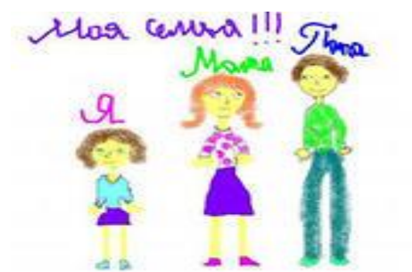
Фамилию и Имя